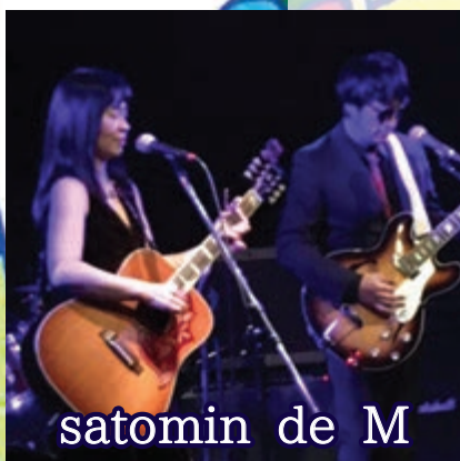
satomin de M

チケットのお求めは、 ☎080-6326-5796(あまさき) または各出演者まで!